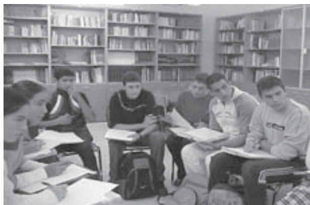
L'equip de redactors de La Puça