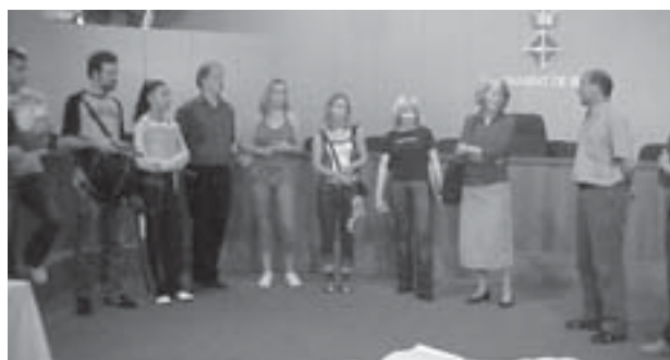
Recepció a la sala de plens de l'Ajuntament