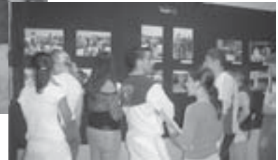
Els alumnes a l'exposició de la Casa Saladrigas