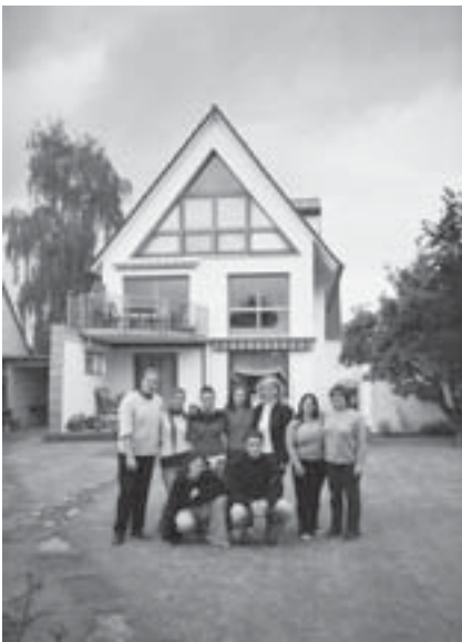
Els participants de l'intercanvi en una casa de Braunschweig

A final de maig i a principis de juny d'aquest any, 6 alumnes del Cicle Superior d'Administració i Finances van realitzar un intercanvi amb un institut alemany de la ciutat de Braunschweig. El projecte d'intercanvi formava part del programa LEONARDO DA VINCI que coordina el Departament d'Educació. L'objectiu d'aquest programa és que els alumnes adquireixin experiència professional en empreses fora del seu país, que coneguin llengües estrangeres i que s'interessin per una cultura diferent. Els alumnes alemanys que van participar a l'intercanvi van venir del 29 de setembre al 28 d'octubre d'aquest any.