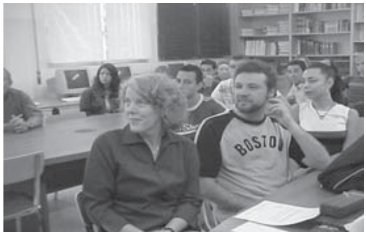
Els alumnes d'Alemanya a la biblioteca de l'institut