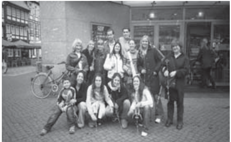
Els alumnes del nostre centre als carrers de Braunschweig

EL PROJECTE LEONARDO ÉS UN PROGRAMA CREAT PER LA UNIÓ EUROPEA, PER ALS ALUMNES DE FORMACIÓ PROFESSIONAL AMB L'OBJECTIU DE PROMOURE L'ESPAI EDUCATIU EN MATÈRIA D'EDUCACIÓ.