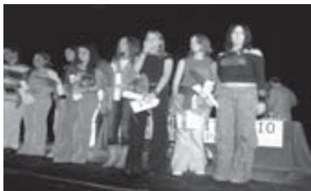
L'Aroa acompanyada dels altres guanyadors