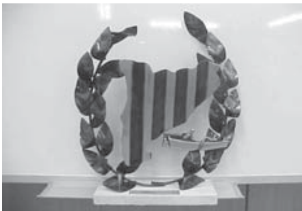
Trofeu del campionat de Catalunya

Aquest any, l'equip també va participar en sis de les set regates de què consta la segona edició de la Lliga Catalana de Llagut. Els guanyadors d'aquesta edició van ser: en 1r lloc, Torredembarra; en 2n lloc, Pescadors Blanes; i en 3r lloc, Santa Cristina de Lloret de Mar.