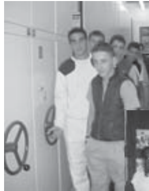
Els alumnes a l'Arxiu Municipal

"Tot plegat va ser divertit i interessant" pensen, perquè cap dels que hi van anar havia vist abans ni la casa Saladrigas ni l'Arxiu Municipal.