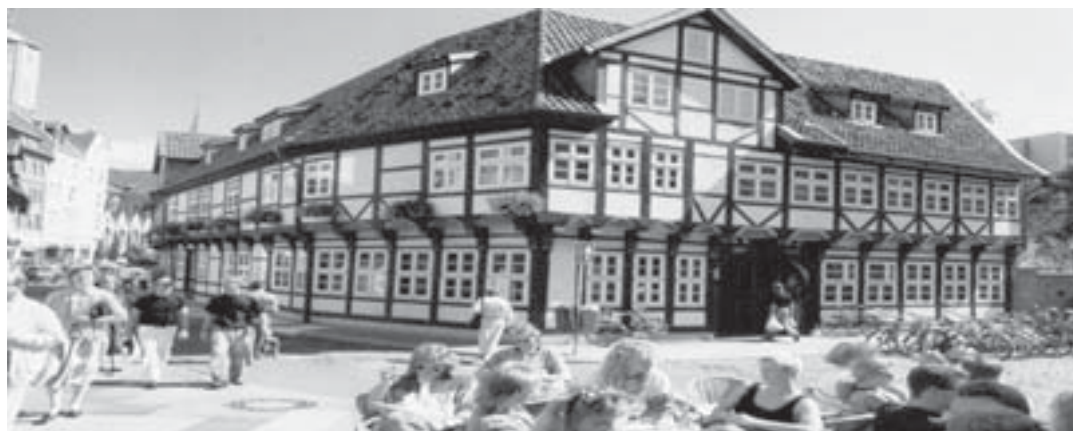
Vista de Braunschweig