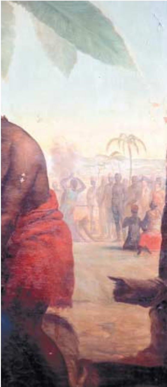
Compra d'esclaus a l'Àfrica, una obra anònima que pertany al Museu d'Art Modern de Barcelona. El dèficit de la balança comercial amb Cuba es va compensar al llarg del període 1814-1832 amb el tràfic d'esclaus organitzat des de Catalunya.