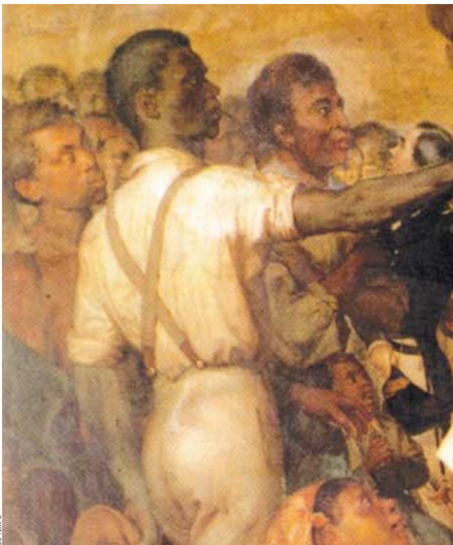
Fragment d' Abolició de l'esclavitud a l'illa Reunió , quadre anònim que commemora aquest fet esdevingut el 20 de desembre de 1848.

El complex procés de l'abolició de l'esclavitud a Amèrica i les revoltes dels esclaus s'allargaren de 1807 a 1888.