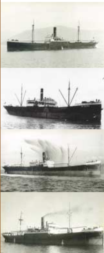
De dalt a baix, quatre dels molts vaixells mercants pertanyents a la sèrie Castillo: són el Castillo La Mota, el Castillo Butron, el Castillo Monforte i el Castillo Peñafiel.

de maig i el 9 de novembre de l'any 1938.