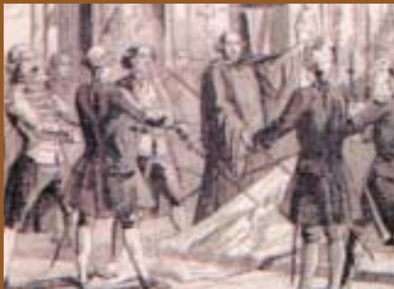
Rafael Casanova i els caps de les milícies juren defensar la ciutat fins al final.