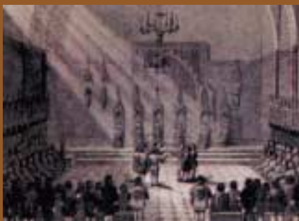
El 16 de maig de 1714 els consellers juren defensar Barcelona al Saló de Cent.