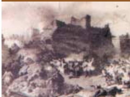
El setge de Barcelona, setembre de 1714.

La formalització del setge va significar una intensificació de la vigilància marítima i la fi de l'arribada regular de queviu-