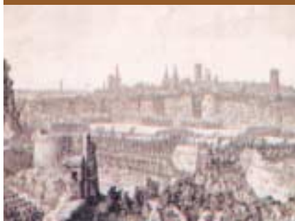
La defensa heroica dels barcelonins no va poder impedir la rendició final.