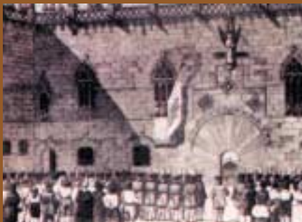
El 24 de juliol de 1713 la bandera de santa Eulàlia és hissada a Barcelona.