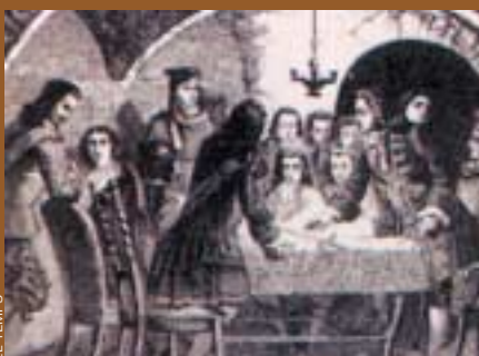
Sessió del Consell de Guerra de Barcelona durant el setge de 1714.

munta empresa de la llibertat.” Ferrer i Ciges tampoc no oblidava Castella: “No dec callar los falsos pretextos en què los ministros castellans, que tiranisen los indefensos pobles de Castella, se serveixen per imbibir perniciosas màximes a aquests senzillos i ignorants habitants, per mantenir-los y acarrear-los més dura l’esclavitud, ab lo encono que com a infecte llavor han sembrat en sos cors lo oprobíós caràcter de rebeldes, calificant axí nostra constància i la unió en mantenir nostres lleis i privilegis. Si la nació castellana reflectàs sobre sos infortunios veuria que en les civils discòrdies que eclipsaren del tot sa llibertat en la desgraciada batalla de Villalar, a 23 d’abril de 1520, no hi tingueren més part los catalans que la de compadèixer-los y llastimar-se de sa desgràcia.”