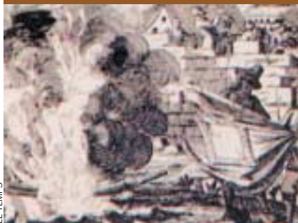
Amb la crema de senyeres s'inicia la repressió borbònica contra Catalunya.