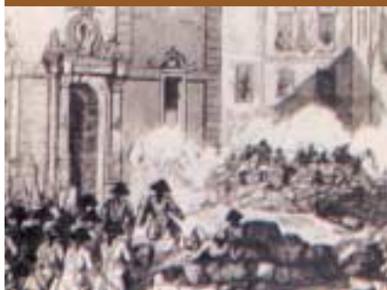
Batalla al carrer Portaferrissa.