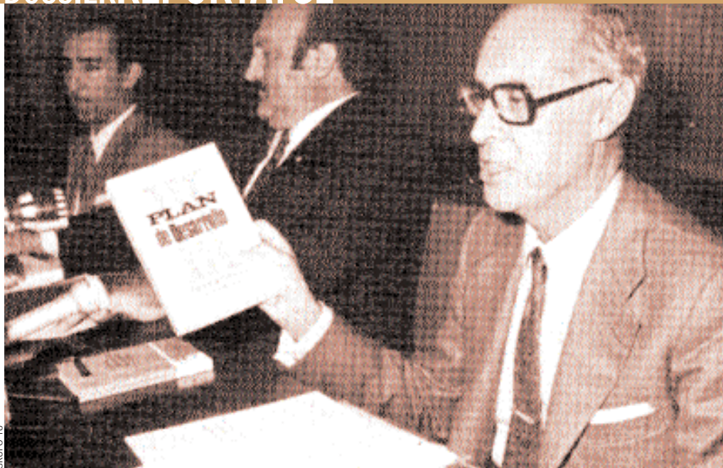
El ministre Laureano López Rodó (en primer terme) i Fabià Estapé presenten el III Pla de Desenvolupament.

materialitzar davant l'opinió pública un gran acord polític. Van ser els Pactes de la Moncloa, signats l'octubre per part dels principals grups parlamentaris, des d'Aliança Popular al Partit Comunista, passant per la governamental UCD i el PSOE. Els Pactes tenien dues parts: una de política, que en gran part avançava criteris de la futura Constitució; i una altra d'econòmica. No deixa de ser significatiu que aquest pacte, d'indubtable naturalesa econòmica, es restringís a l'acord dels partits polítics, deixant de banda els agents socials. Els Pactes de la Moncloa van significar l'inici d'una veritable política econòmica, que descansava en un paper important de l'estat, que hauria de definir una política de rendes. Per a això era imprescindible una reforma fiscal. Si aquesta assolía una major recaptació, la despesa pública també es podria incrementar. Definida aquesta línia d'actuació, la negociació col·lectiva entre sindicats i empresaris quedava en un total segon pla, ja que el Govern tenia suficient força per imposar que els objectius macroeconòmics condicionaven totalment a aquella negociació. L'efecte entre els treballadors va ser ben clar: els recentment legalitzats sindicats van anar perdent ràpidament afiliació, ja que quedaven lligats de mans i peus pels acords polítics signats pel PSOE i el PCE. Per això el que se'n va dir "desencís"; és a dir, la ràpida desmo-