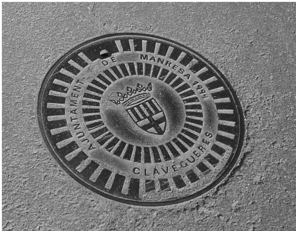
Tapa d'un pou de registre de Manresa

Un problema difícil de resoldre són les rates, que han fet del clavegueram el seu hàbitat. Poden causar problemes sanitaris i desperfectes a les instal·lacions de gas o electricitat soterrades. Un cop al mes es posa raticida en punts estratègics, tot i això mai s'aconsegueix eliminar-les totalment.