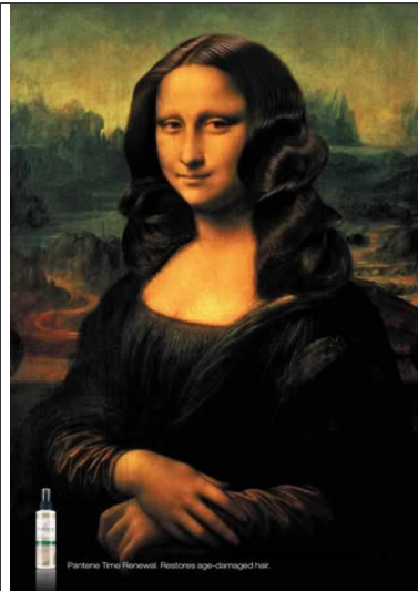
Publicitat de Pantene