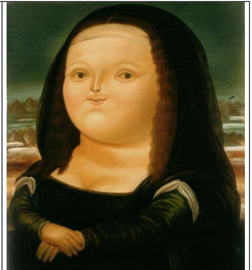
Pintura de Fernando Botero