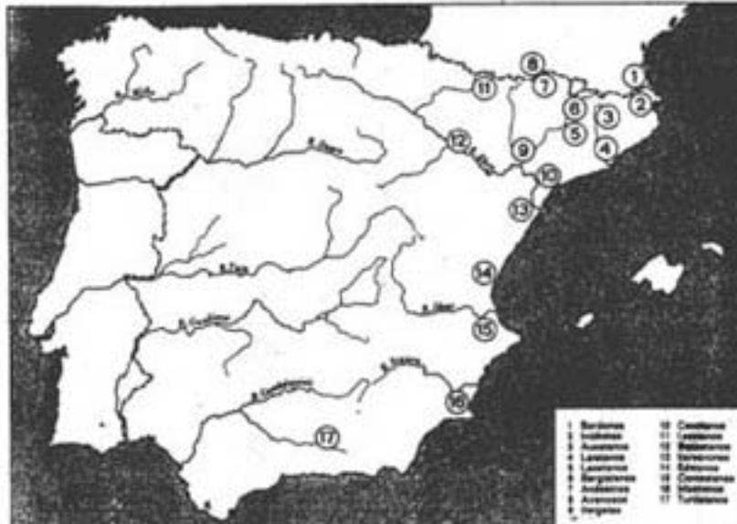
Figura 36. Localització dels diferents pobles ibèrics (segons J. Mangas).

És especialment significativa la referència aportada per Plini . Aquest autor, al llarg de la seva descripció del litoral nord-oriental de la Hispania Citerior , estableix una diferenciació entre populi i regiones ( Plini , N.H. III, 4, 18-30), fet en el qual R.C. Knapp s'ha fonamentat per a llançar la suggerent hipòtesi de l'existència de dos sistemes d'estructuració del territori conquerit per Roma. Per a Knapp , mentre l'estructura administrativa en regiones fou aplicada a la zona de romanització més primerenca de la Hispania Citerior , l'organització en populi correspongué a la resta de la província menys romanitzada. Knapp ens diu textualment: «it seems probable that Pliny was doing more than just listing geographical areas when he chose the terms he used in his account: Rome seems to have supervised Citerior before the time of Augustus on the basis of regiones along the coast and lower Hiberus river valley, and on the basis of populi in the interior and along the north <we>st coast» 2 .