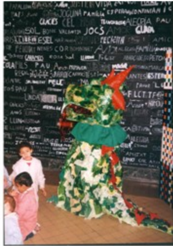
(Mural St. Jordi 2003-2004)