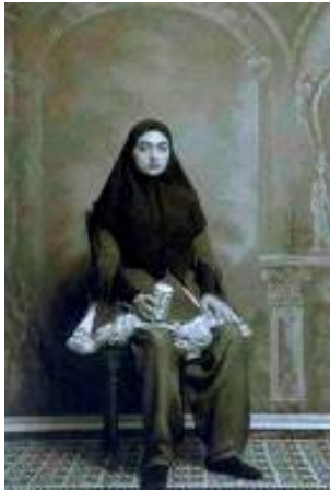
-Shadi Ghadirian. "Qajar" 1999 (Solans, 2005; 70)

- M'interessen les fotos antigues, m'agraden-