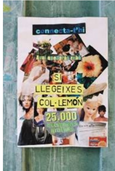
(Cartell revista escola 2004-2005)

Algunes de les visites expositives a museus també incideixen en aspectes tant rellevants com la descoberta, a partir de la simbologia i de la càrrega semàntica, dels objectes artístics i de les relacions polítiques i socials dels homes.