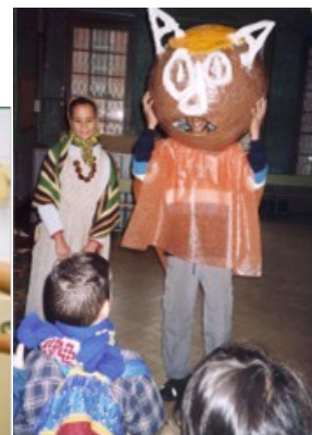
(Projecte cap gros castanya, elaboració i festa)