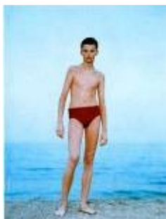
-Rineke Dijkstra, Odessa, 1993 (Grosenick, 2002; 105)

En Kevin va aparellar la seva fotografia amb la imatge de Rineke i va argumentar el següent: