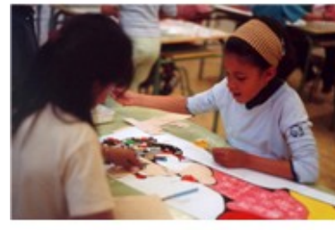
(Col.laboració amb l'artista Oswald Aulestia)

Amb aquesta forma organitzativa vam poder contextualitzar la diversitat en les formes de relació amb els materials plàstics des de la contínua interrelació entre experiència i producció. Les propostes de relació amb els materials plàstics potenciaven l'apreciació de les diferències entre els companys, tant pel que fa a l'humor, el temperament, la motivació, la intenció i el gust. A més, les expectatives que fomentaven iniciaven processos d'autoconeixement compartit: la recreació amb els estats d'ànim, amb les expectatives, amb les intencions, amb la vibració que flueix entre les accions i la matèria plàstica i, en definitiva, amb les diferents formes en que els materials arribaven a captivar l'atenció dels alumnes. L'àmbit del taller ja permetia, en primera instància, començar a dissenyar una primera part del seu currículum que de forma esquemàtica puc sintetitzar de la següent manera: