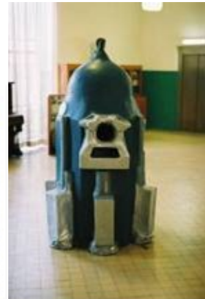
((Projecte "Verne": mural-exposició)