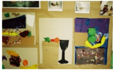
(Treballs realitzats en el taller "Joc de llums i ombres: natura morta" MNAC, Barcelona)

El dibuix amb model s'anava configurant com una de les activitats primordials en el taller. Presentat com una activitat d'observació, els alumnes varen demostrar estar incentivats degut als avenços que feien; després de cada sessió podíem comprovar les millores que feien tot ordenant els seus apunts. Cal destacar també el gaudi que tenien durant aquestes sessions en observar al company/a a l'hora de dibuixar-lo.