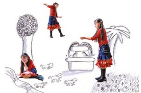
El retrat de l'Aracely

Xavier: -Dibuixa diferents parcs i el que t'agradi més el posarem al fons. Farem un muntatge-