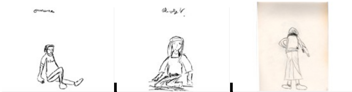
(Apunts de model realitzats al taller de l'escola)

El dibuix amb model s'anava configurant com una de les activitats primordials en el taller. Presentat com una activitat d'observació, els alumnes varen demostrar estar incentivats degut als avenços que feien; després de cada sessió podíem comprovar les millores que feien tot ordenant els seus apunts. Cal destacar també el gaudi que tenien durant aquestes sessions en observar al company/a a l'hora de dibuixar-lo.