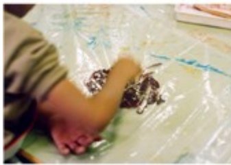
(Produccions realitzades en el taller)