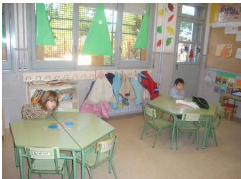
Les taules de treball abans