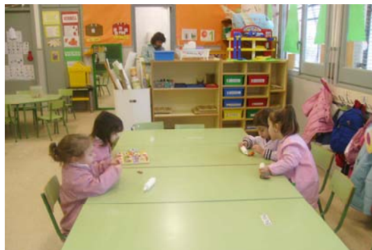
Les taules de treball després