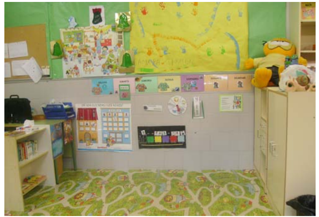
El racó de la catifa després.