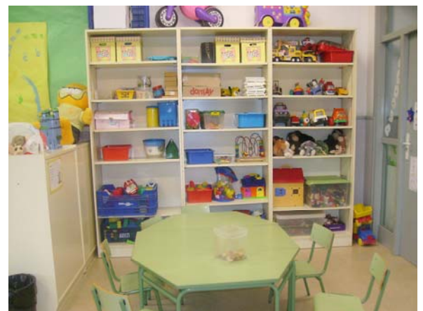
Les taules auxiliars després.