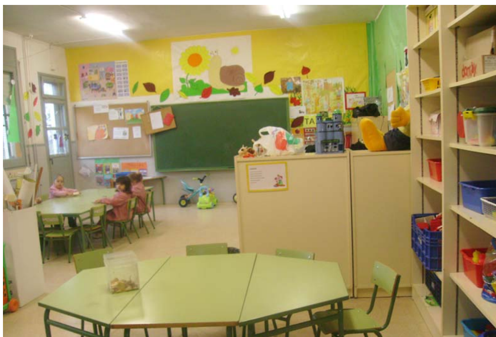
Vista general de l'aula actual.

Aquest canvi també va permetre deixar el racó de l'ordinador més a la vista, i accessible, que abans quedava amagat suscitant un interès desmesurat dels nens i nenes, que el veien com una cosa prohibida.