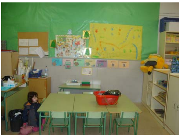
Les taules auxiliars abans.