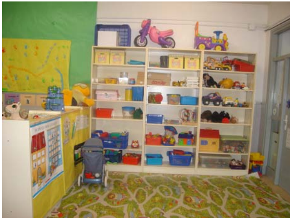
El racó de la catifa abans