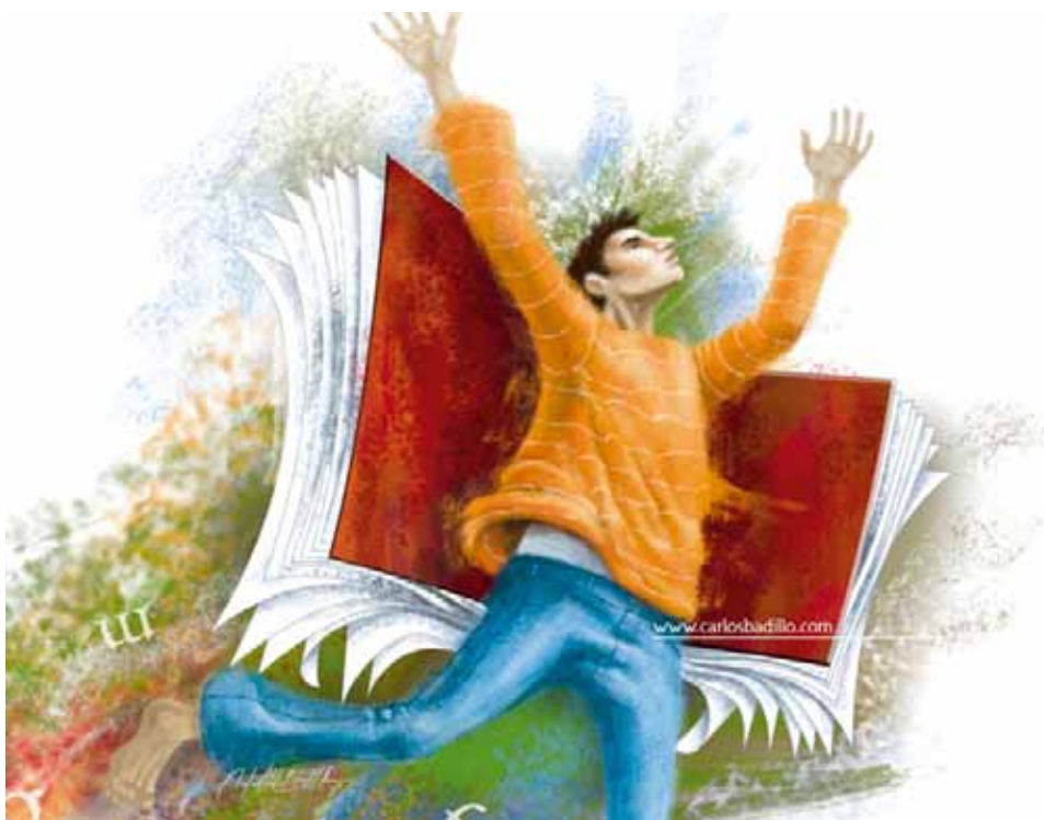
(4 a Feria Estatal del Libro, Mèxic 2005, Carlos Badillo)