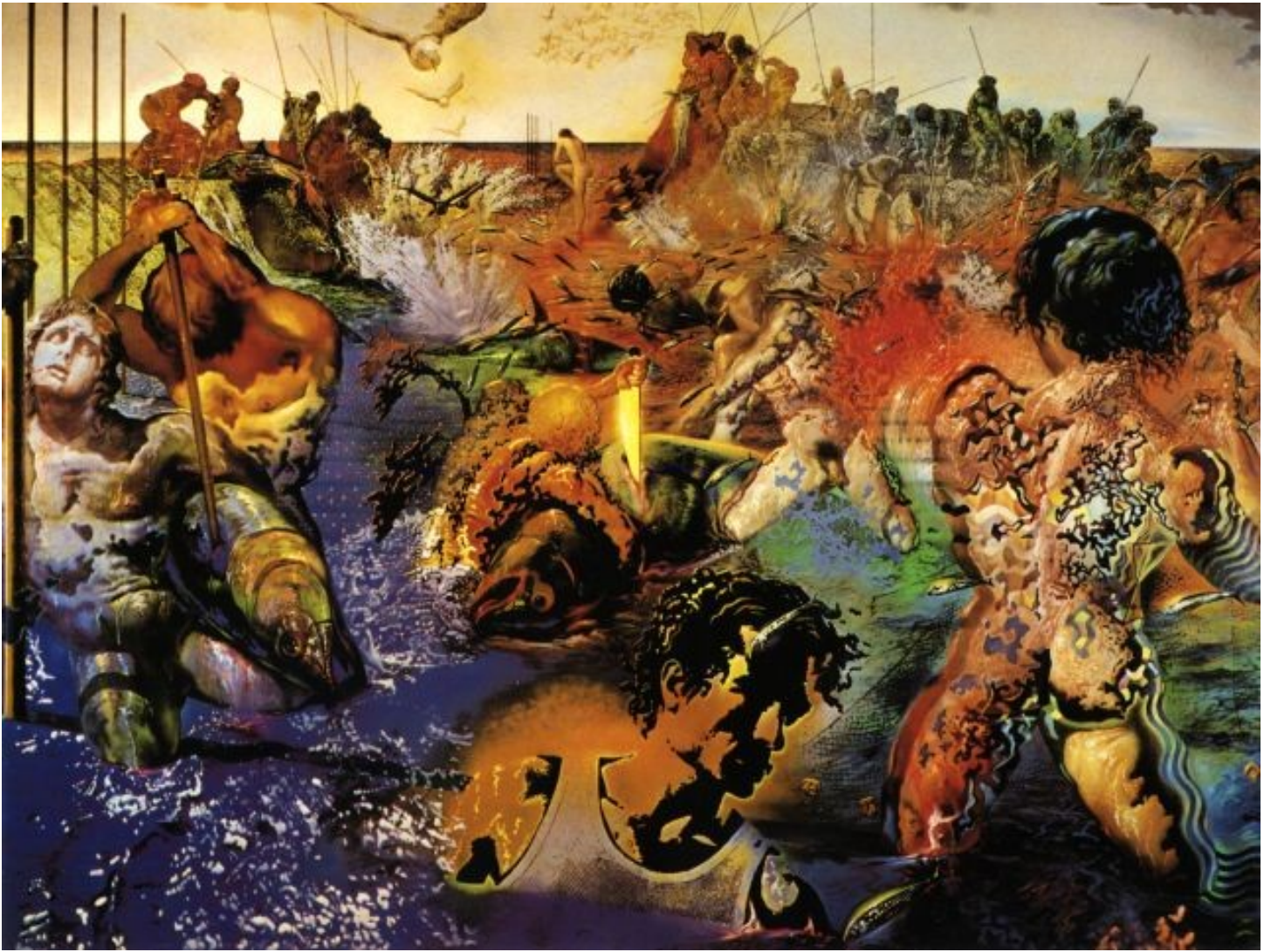
La pesca de la tonyina 1966-1967