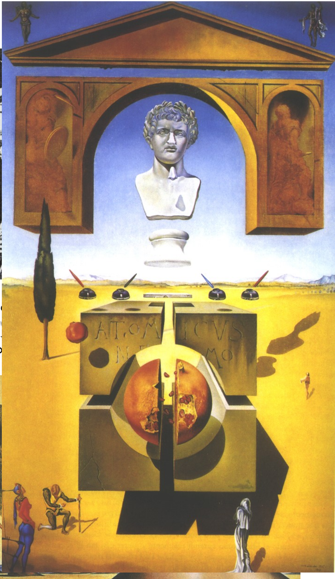
La separació de l'àtom 1947