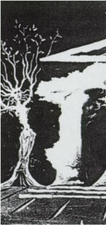
Sense títol (Fr bombes atòmiques en forma de b