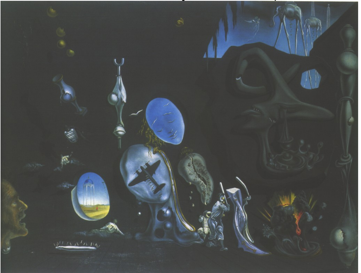
Idil·li atòmic o urànic malencònic 1945

"L'explosió atòmica el 6 d'agost de 1945 m'havia esgarrifat sísmicament. A partir d'aquests moment l'àtom va esdevenir el meu subjecte de reflexió preferit.