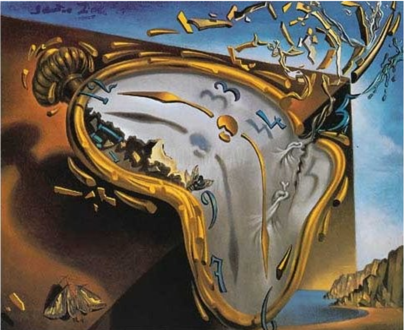
Relotge tou en el moment de la primera explosió 1954

Fa més de 2500 anys que Aristòtil ja havia analitzat el problema del temps : el temps era la mesura del moviment en la perspectiva de l'abans i el després. Però què és el que marca l'abans i el després? Som nosaltres els que donem la perspectiva entre l'abans i el després?