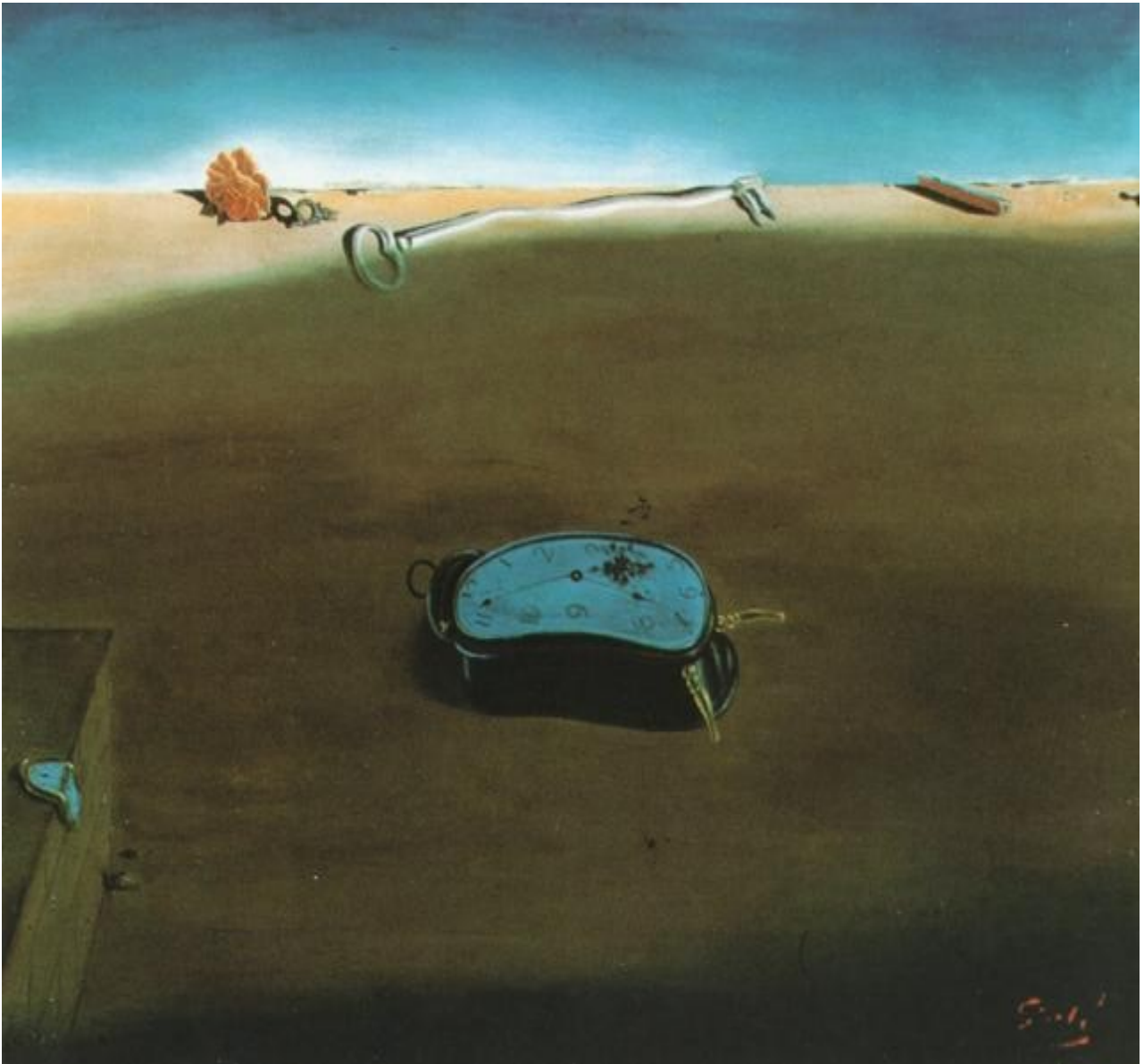
Relotges tous 1933