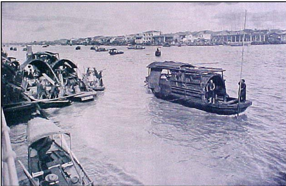
Imatge 3. El port de Canton. Fotografia de finals del segle XIX.

Els manxús dominarien Xina fins el 1912. Tot i ser considerada sempre pel poble com una dinastia estrangera, practicà una política xenòfoba. El 1724 foren expulsats els missioners catòlics. El 1757 ordenaren que el comerç amb els europeus es concentrés exclusivament en el port de Canton. Totes les altres ciutats xineses restaven prohibides als estrangers.