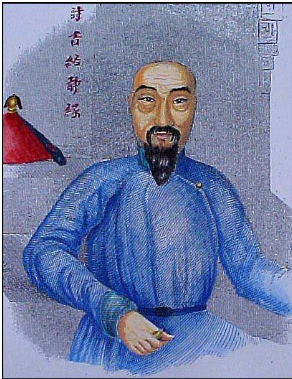
Imatge 7. El comissari imperial Lin Tse-Su.

Per aquest motiu l'emperador Tao-Kuang havia decidit solucionar el problema enviant a Canton un Alt Comissari, un càrrec excepcional que només s'utilitzava en casos d'emergència nacional. El nomenament va recaure en Lin Tse-Su, un mandarí intel·ligent i capaç. Tenia cinquanta quatre anys. Havia governat sàviament en dues províncies. Se'l considerava un bon poeta, cosa molt apreciada a Xina. Tao-Kuang en persona mantingué amb Lin disset llargues entrevistes, en el decurs de les qual dissenyaren l'estratègia per acabar amb l'opi. Quan Lin arribà a Canton, el darrer dia de 1838, estava convençut del seu èxit.