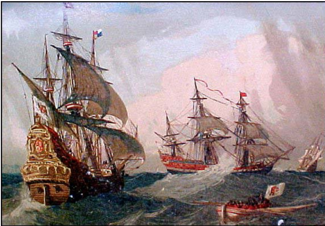
Imatge 2. Vaixells europeus del segle XVII. Infinalment superiors als sampans, la seva potent artilleria assegurà a les potències europees el control de la costa i el mar de Xina.

artesans elaboraven peces de porcellana considerades encara avui d' una qualitat artística insuperable. I novament vingueren els estrangers a pertorbar el regne.