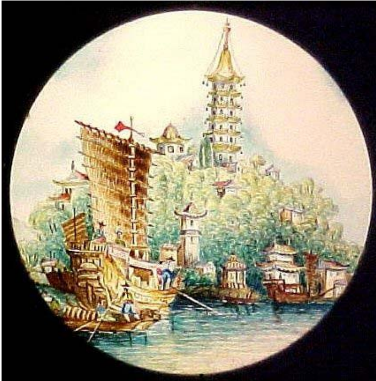
Imatge 10. Port de Nankín. Placa de llanterna màgica, possiblement del temps de la Guerra de l' Opi.

Reanudada la guerra, les victòries dels britànics ( reforçats ara amb 12.000 homes ) foren constants. Malgrat l'heroica resistència dels xinesos, que preferien el suïcidi abans de la rendició, els britànics ocuparen Chen-hai, Ningpó (ciutat de 250.000 habitants ), Xangai, i enfonsaren la flota xinesa. Finalment, quan la flota britànica assetjava el port de Nankín, Tao Kuang acceptà la derrota.