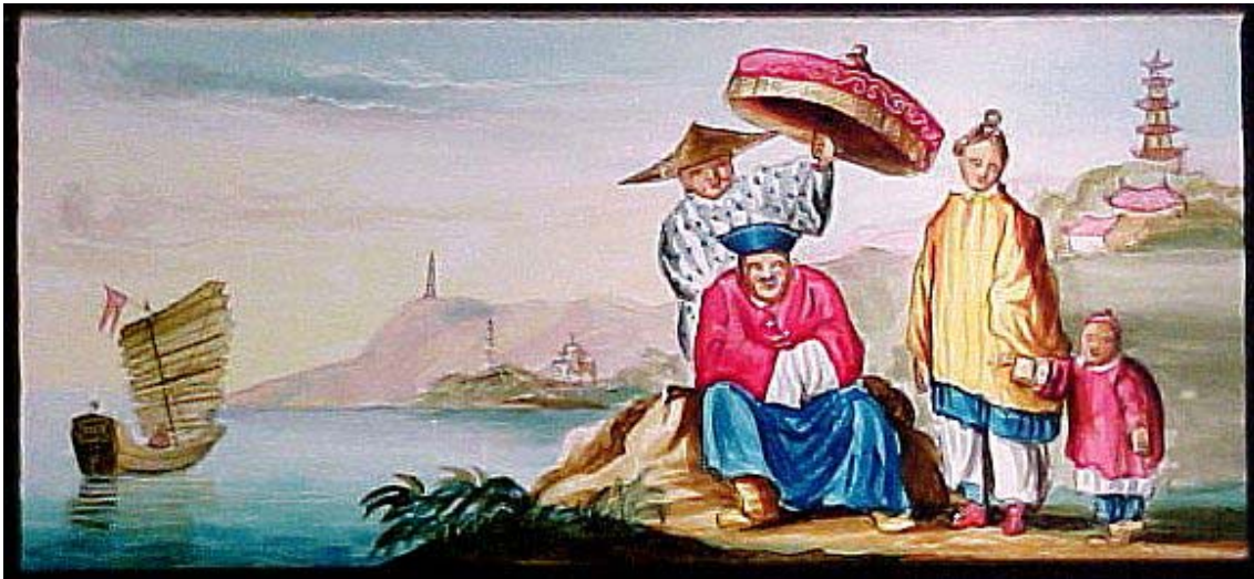
Imatge 1. Paisatge i família xinesos. A a dreta, dalt d' un turó, una pagoda o temple xinès; en el mar, un típic sampan . Placa de llanterna màgica. Principis del segle XIX.

A finals del segle XVIII la Xina Imperial tenia 400 milions d'habitants. Això significava que un de cada cinc pobladors del planeta era súbdit del Gran Xin, el Fill del Cel, l'Emperador Sublim. Sens dubte, un país formidable. Napoleó ho advertia: "Xina és un gegant adormit, però quan es desperti el món tremolarà". Europa admirava les dimensions increïbles de l'Imperi Celestial.