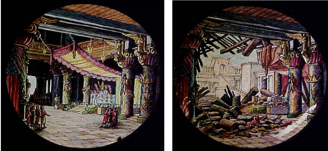
Imatge 13. La Sala del Tron del Palau Imperial abans i després de la seva destrucció per tropes franceses. Plaques de llanterna màgica, aproximadament de 1860.

A partir de 1861 el poder de Xina estaria en mans de Tse-Shi, emperadriu-regent. Era una dona de caràcter ferotge, implacable amb tothom.. Per entendre el seu caràcter, només cal un exemple: malgrat ser ella mateixa addicta a l'opi, promulgà una llei que condemnava a mort els qui consumien aquesta droga. Milers de persones foren executades, mentre Tse-Shi continuava fumant opi tranquil·lament.