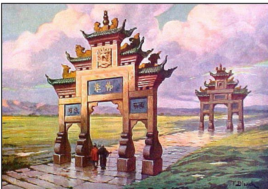
Imatge 9. Arcs commemoratius xinesos.

El 9 de juny de 1840 arribà a Canton la flota britànica. La formaven tres vaixells de 74 canons, dues fragates de primera classe de 46 canons, 5 fragates de segona classe de 28 canons, vuit corbetes de 18 canons i 27 transports amb 3.600 soldats. Manava aquesta estol imponent el cosí de Charles Elliot, l'almirall Georges Elliot, qui assegurava tenir per objectiu la defensa dels drets dels xinesos contra els abusos del Comissionat Lin. Costa imaginar més cinisme.