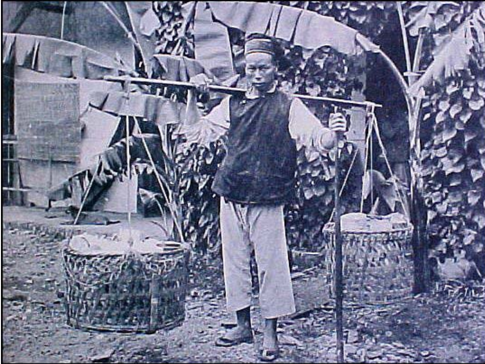
Imatge 5. Venedor ambulat de vaixelles a Mukden, capital de Manxúria. Fotografia d'aproximadament 1890. Per a la mentalitat xinesa, el comerciant era un paràsit social, donat que es limitava a distribuir i vendre productes elaborats per altres persones.

Els comerciants xinesos de Canton s'agrupaven obligatòriament en un sindicat denominat "Cohong", presidit per un mandarí, anomenat "Hoppo". De tant en tant, (sobretot quan la cort de Pekín necessitava diners) el "Hoppo" exigia als membres del "Cohong" impostos extraordinaris, molt elevats, que arruïnaven els comerciants més febles. El producte que venien als europeus era bàsicament el te. A canvi, exigien monedes espanyoles de plata, únic valor occidental acceptat per l'Imperi Celestial. Fins el 1800 aquest sistema resultava satisfactori per les dues parts. Aviat havia de canviar.