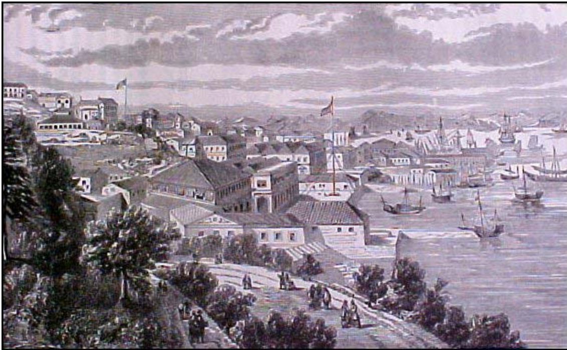
Imatge 11. El port de Hong Kong en un gravat de 1847.

William Jardine acumulà una immensa fortuna traficant amb opi. Es convertí en membre del Parlament britànic, però tot li resultà inútil davant d'una malaltia qualificada de “penosa, llarga i atroç” pels seus contemporanis. Morí, entre horribles sofriments, el 1843.