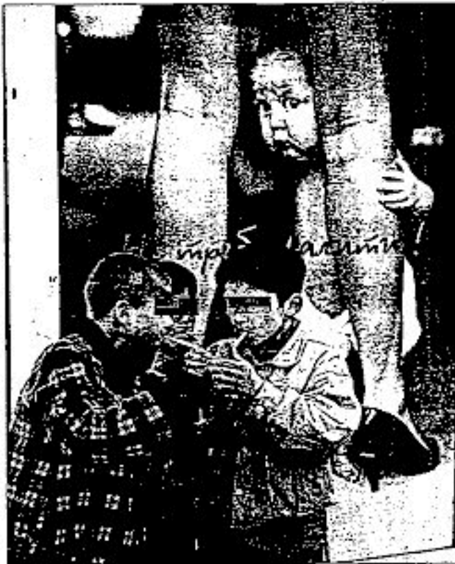
Tres niños de ocho años encienden sus cigarrillos en Kiev.

El equipo hizo las pruebas tomando muestras del tejido pulmonar de esos pacientes con cáncer para determinar los niveles de alteraciones que había por cada 10.000 millones de