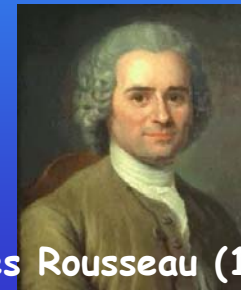
Jacques Rousseau (1712-1778)

"Hay un libro abierto siempre para todos los ojos: la naturaleza".