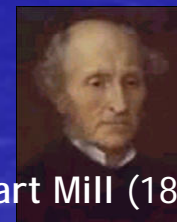
John Stuart Mill (1806-1873 )

Los problemas medioambientales parece, en principio, que sólo son problemas técnicos cuya solución compete a los Estados, a los poderes públicos, pero no a las personas privadas. Sin embargo, no es así. Las acciones que realizamos los seres humanos libremente, si tienen consecuencias para los demás, son acciones morales, acciones que, por lo mismo, han de estar guiadas y orientadas por unos valores morales, sometidas a unas normas que provengan de ellas.