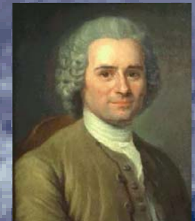
J.J. Rousseau (1712-1778)

“Hay un libro abierto siempre para todos los ojos: la naturaleza”.