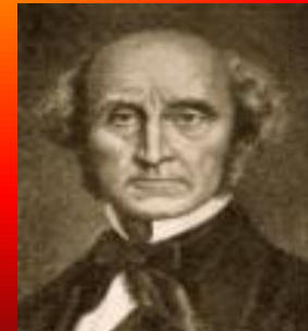
John Stuart Mill

"No existe una mejor prueba del progreso de una civilización que la del progreso de la cooperación."