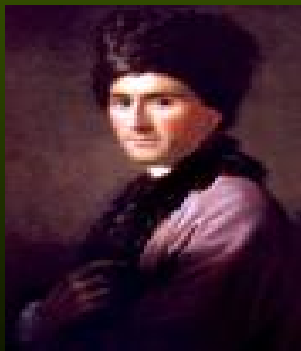
Jean Jacques Rousseau. (Escritor y filósofo francés. 1712-1778)

"Siempre es más valioso tener el respeto que la admiración de las personas".