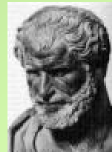
Democritus from Abdera

Demócrito de Abdera (Filósofo. 460-370 a.C)