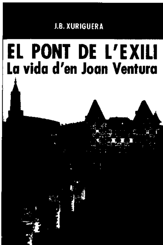
Coberta d'El pont de l'exili (1987), novel·la que tanca el cicle La vida d'en Joan Ventura.