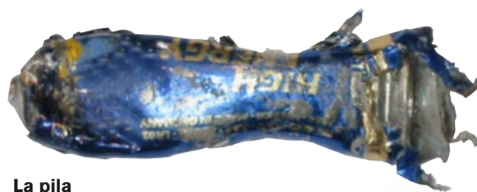
La pila Origen: Carrers de la ciutat, rieres i embarcacions. Conducta: Els líquids que despren són altament verinosos. Mitjana de vida: Milers d'anys.