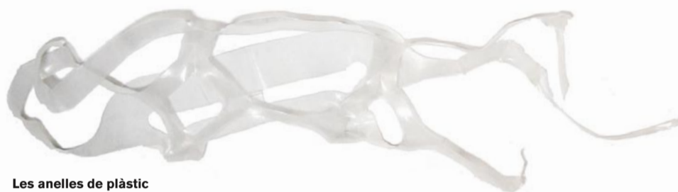
Les anelles de plàstic Origen: Platges i carrers de la ciutat. Conducta: Atrapa organismes marins i els ocasiona greus ferides o la mort. Mitjana de vida: 450 anys.