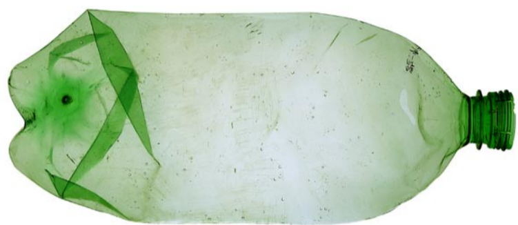
L'ampolla de plàstic Origen: Platges, carrers de la ciutat i embarcacions. Conducta: Ocasiona greus danys a la fauna i flora marina. Mitjana de vida: De 300 a 500 anys.