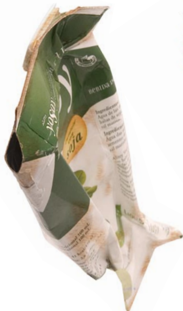
El tetra-brik Origen: Platges i carrers de la ciutat. Conducta: Provoca un efecte abrasiu als organismes fixats al fons marí. Mitjana de vida: De 25 a 50 anys.