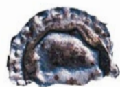
El tap d'ampolla Origen: Carrers de la ciutat, platges i embarcacions. Conducta: Ocasiona problemes digestius a la fauna marina. Mitjana de vida: 300 anys.