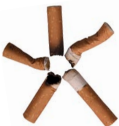
Les puntes de cigarreta Origen: Vàters, platges, rieres i carrers de la ciutat. Conducta: Impedeix la correcta digestió a alguns animals. Mitjana de vida: 10 anys.