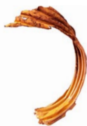
El tros de plàstic Origen: Fàbriques i carrers de la ciutat. Conducta: Es deixa ingerir per altres animals i els intoxica. Mitjana de vida: Centenars d'anys, depenent de la quantitat.