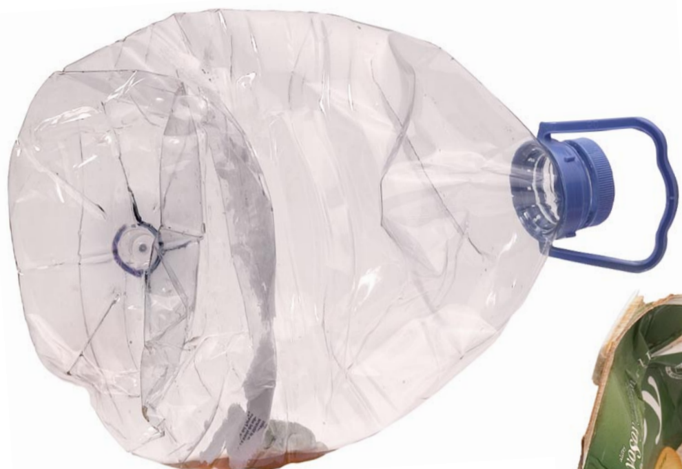
La garrafa de plàstic Origen: Carrers de la ciutat, platges i rieres. Conducta: És ingerida per animals i els provoca serioses intoxicacions. Mitjana de vida: De 400 a 600 anys.