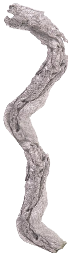
El paper d'alumini Origen: Platges, carrers i rieres. Conducta: Provoca un efecte de recobriment en alguns organismes, impedit l'alimentació. Mitjana de vida: 5 anys.