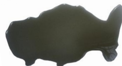
El gasoil i l'oli de motor Origen: Embarcacions. Conducta: La seva toxicitat destrueix l'habitat allà on arriba. Mitjana de vida: Varia segons la quantitat abocada.