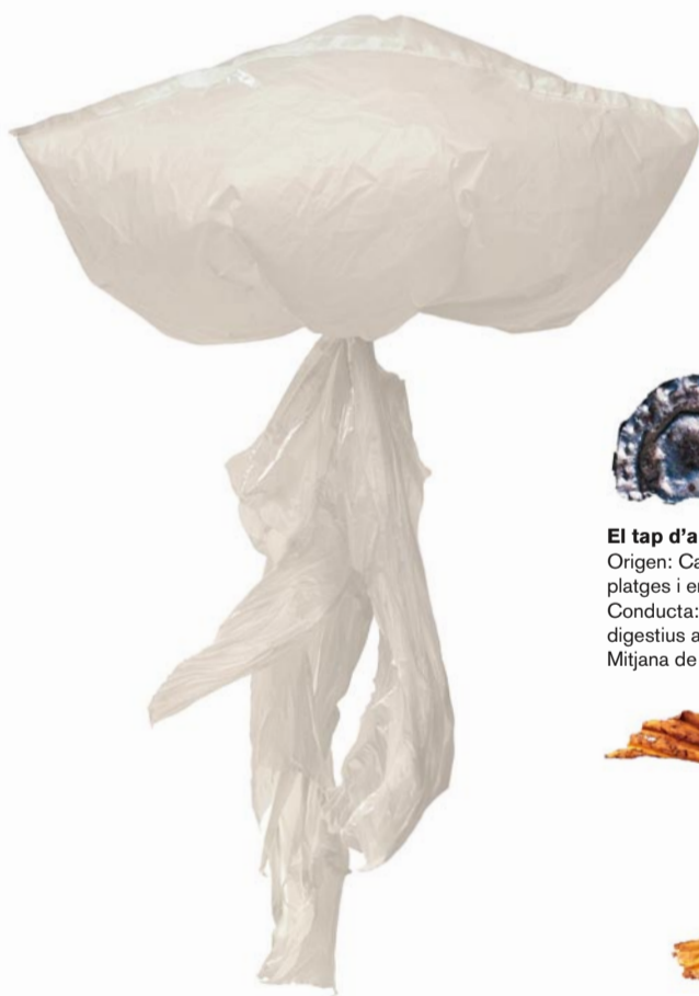
La bossa de plàstic Origen: Carrers de la ciutat, platges i embarcacions. Conducta: Fent-se passar per medusa, és ingerida per altres animals i els intoxica. Mitjana de vida: De 35 a 60 anys.