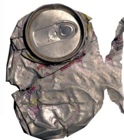
La llauana Origen: Carrers de la ciutat i platges. Conducta: Causa talls i punxades a la fauna marina i als banyistes. Mitjana de vida: De 200 a 500 anys.