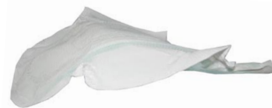
La compresa Origen: Platges, vàters i embarcacions. Conducta: Impedeix la correcta digestió dels animals que la ingereixen. Mitjana de vida: 25 anys.

A tot el món, 8 milions de tones de residus arriben al mar cada dia. Tota aquesta brutícia s'origina per l'acció humana. Són residus no reciclables llençats al vàter, al carrer, a les rieres, a la sorra de la platja o al mar, que es converteixen en veritables destructors de la vida marina. Però tu pots evitar-ho.