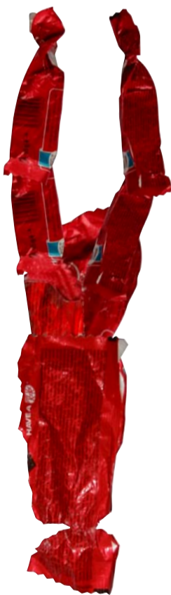
L'envoltori de menjar Origen: Platges i carrers de la ciutat. Conducta: Ocasiona greus danys a la fauna i flora marina. Mitjana de vida: De 20 a 30 anys.