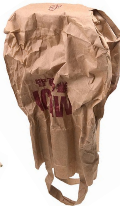
La bossa de paper Origen: Platges i embarcacions. Conducta: Dificulta greument la digestió a alguns animals marins. Mitjana de vida: 4 setmanes.