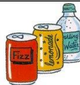
fizzy drinks: coke, lemonade, orange or lemon