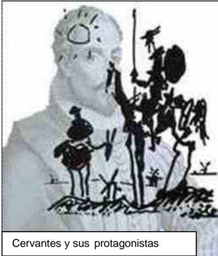
Cervantes y sus protagonistas

Novelista, poeta y dramaturgo español. Nació el 29 de septiembre de 1547 en