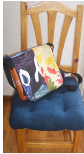
La bossa és a sobre de la cadira