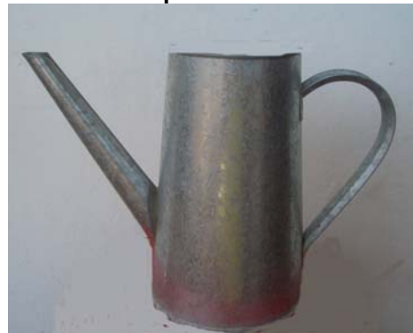
Vista lateral : només es veu una sola cara de l'objecte