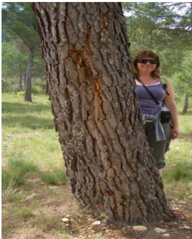
La Nieves és darrera el tronc