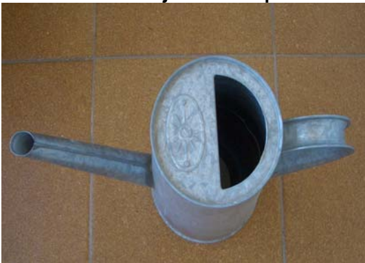
Vista obliqua : es veu més d'una cara de l'objecte

El mateix objecte el poden mirar des de diferents punts de vista