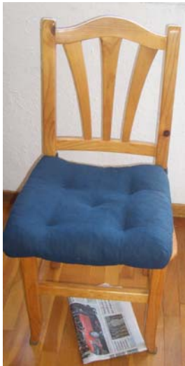
El diari és a sota de la cadira