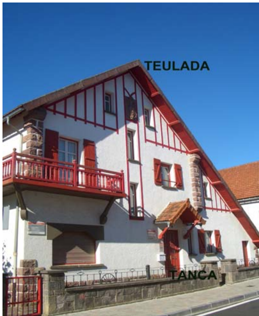
La teulada és a dalt la casa