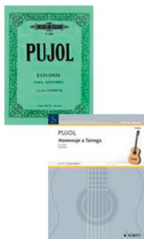
EL ABEJORRO ESTUDIO

Escriu obres per a dues guitarres i, amb la idea d'ampliar la literatura per a guitarra, cal destacar també una gran quantitat de transcripcions de partitures de compositors de totes les èpoques.