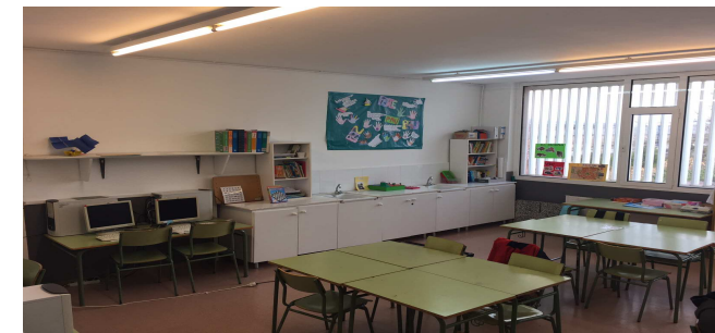
Treball en grups reduïts