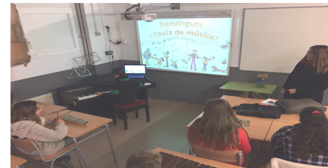
Aula de música