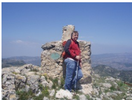
El cim del Molló Puntaire