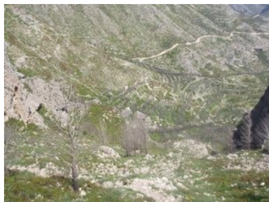
Imatge del camí cap al cim